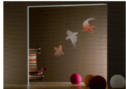
Die neue Falztechnik verbindet eine grosszügige horizontale Fältelung mit kleinen Knitterfältchen, durch Metallpigmente zart akzentuiert. Dazu gibt es als Set oder als Einzelbahn japanische Koi. (Marburg, Kollektion Crash Lounge, Go east)

Extravaganz, aber auch Sinnlichkeit sind offensichtlich die Trends bei der Wandbekleidung. Aber auch Streifen trägt Wand heute wieder vermehrt. Wie sehr die Tapete als ultimatives Raumgestaltungselement geschätzt wird, beweist Zaha Hadid, eine der bekanntesten Persönlichkeiten der internationalen Architektur- und Designszene. Erstmals hat sie nun für marburg wallcovering Wanddesign kreiert. Alles was Zaha Hadid gestaltet, folgt dem gleichen hohen Anspruch: Es ist neu, noch nie dagewesen, es ist überragend durchdacht und es funktioniert. So auch ihre Tapetenentwürfe, mit denen sie alle Sehgewohnheiten sprengt.