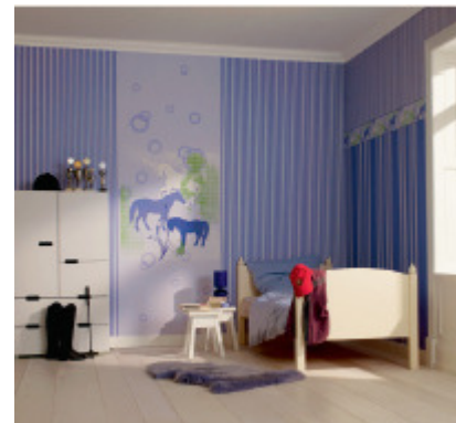
Adequat und nach Herzenslust gestalten. Romantische Mädchen finden hier, was sie am meisten mögen: Pferdomotive in Flieder und Rosa. (Marburg, Kollektion Manekin. Kinderwelten)